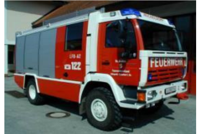
Pumpe 2: Steyr 12S22 4x4, Bj 2002, 163 KW, GG: 12 to Absetzblock mit TS 12, integrierte Schlauchhaspel, Notstrom, 5to Einbauseilwinde, Atemschutz 200bar, Tauchpumpen, Naßsauger