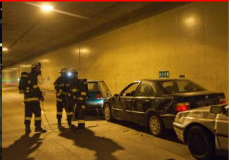
Übung A9 09.05.2011