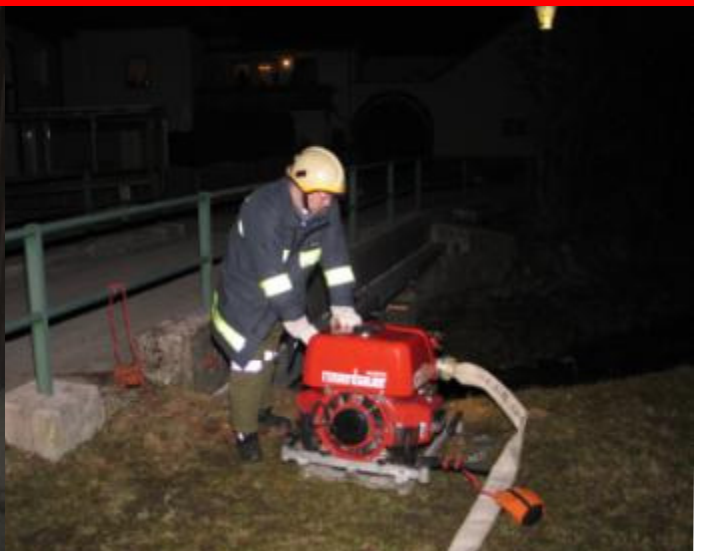
Übung landwirtschaftliches Objekt 10.03.2011