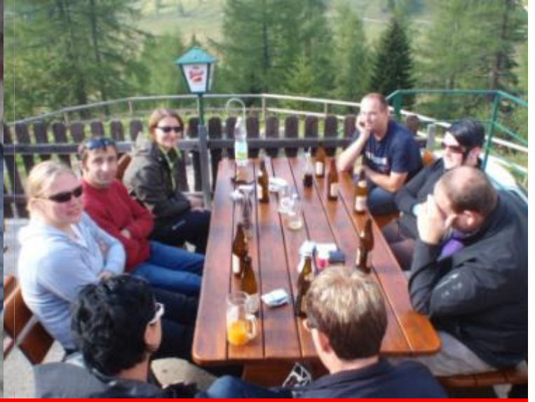
Feuerwehrausflug bei tollem Wetter auf die Wurzeralm – Wandern und Relaxen war angesagt