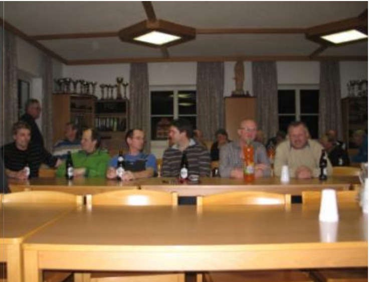
Monatsabend – Suchbild – Finde den Fehler!