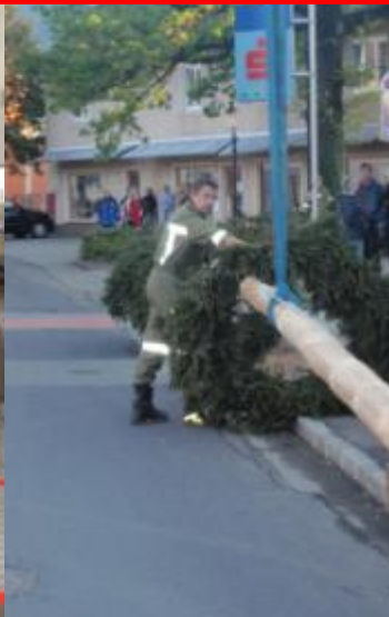
Maibaumaufstellen – traditionell durch die FF