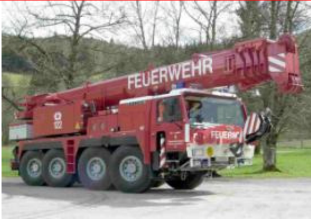
Kran: Liebherr LTM 1070/1, Bj 1999, 300KW, GG: 48to, Stützpunktfahrzeug 50to Nennleistung, 20 to Rotzler Seilwinde, Oberwagenmotor 120KW