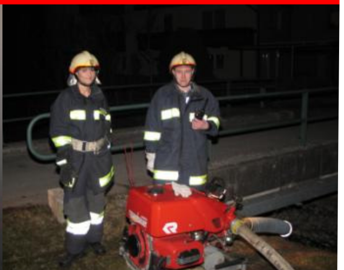
Übung landwirtschaftliches Objekt 10.03.2011