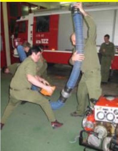
Auch in Silber geht's schnell!