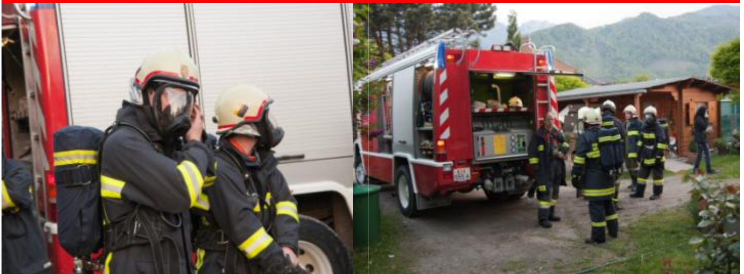
Kaminbrand in Micheldorf 04.05.2011