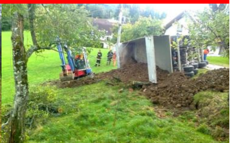
LKW Bergung in Altpernstein am 12.10.2011