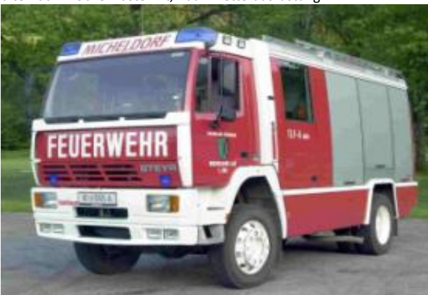
Tank 1: Steyr 16S26 4x4, Bj 1996, 191KW, GG: 16 to 4000 l Wasser, 200 l Schaummittel, Notstrom 8 kVA, Atemschutzgeräte 300 bar, Überdrucklüfter.