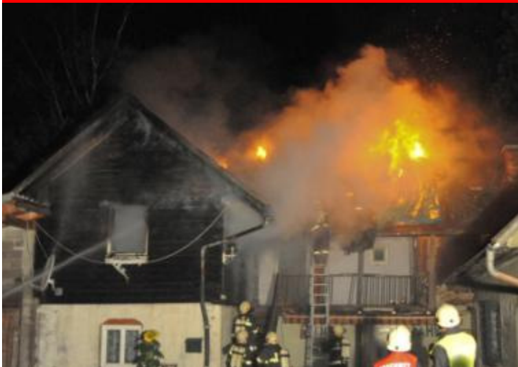
Brand Wohnhaus Hilbing