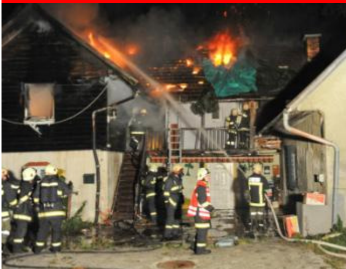
Brand Wohnhaus Hilbing