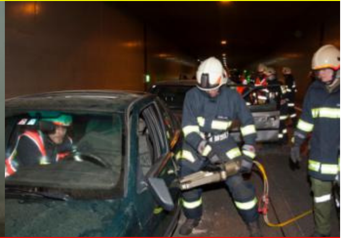
Übung A9 09.05.2011