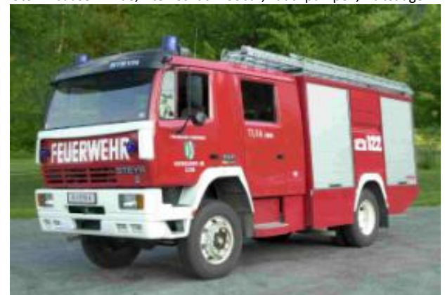
Tank 2: Steyr 13S21 4x4, Bj 1988, 154KW, GG: 13 to 2000l Wasser, Notstrom 8 kVA, Säure- & Vollschutzanzüge, Atemschutzgeräte 200 bar, Überdrucklüfter, 3 teilige 14 m Schiebeleiter