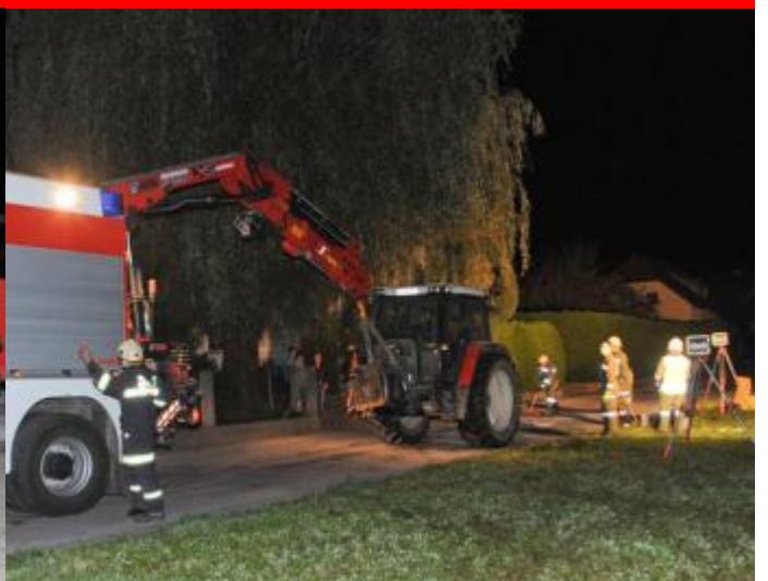
Traktorbergung Micheldorf am 04.10.2011