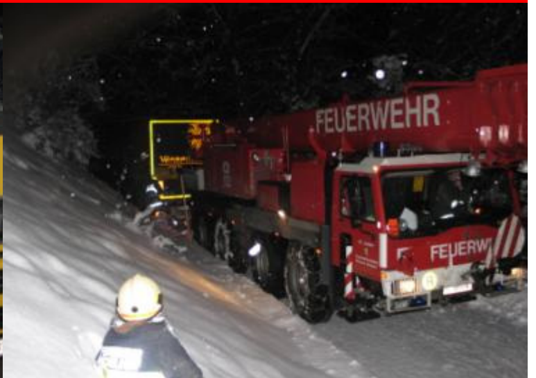
LKW Bergung in Klaus am 26.01.2011