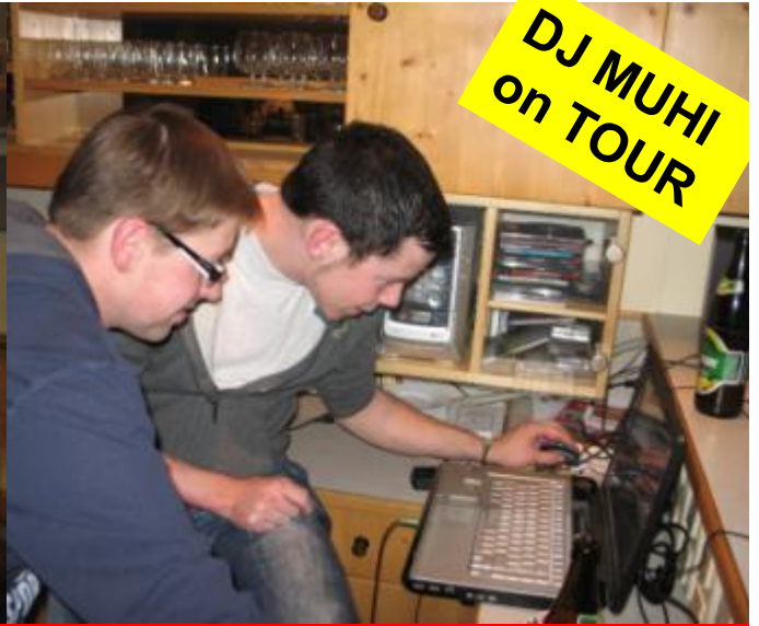
Auch Feuerwehrmänner werden ÄLTER! Danke für die tolle Party!