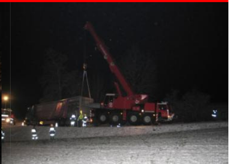
LKW Bergung in Ried/Traunkreis 20.01.2011