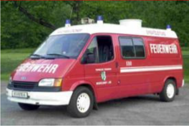
KDO: Ford Transit, Bj 1994, Turbodiesel, 73 KW Spreizer, Schere, Hebekissen, Notstrom, Beleuchtung, Erste Hilfe, Lotsen- & Kommandoeinrichtungen