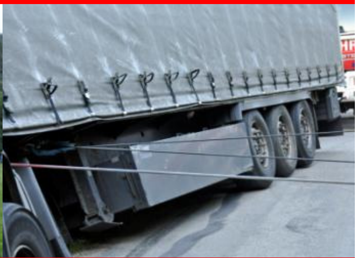
LKW Bergung in Scharnstein, Juni 2011