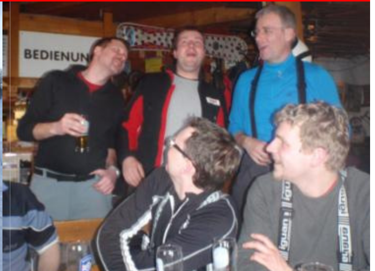
Unsere Kämpfer top motiviert – und den Einkehrschwung haben wir auch nicht verlernt! A GAUDI WOARS!