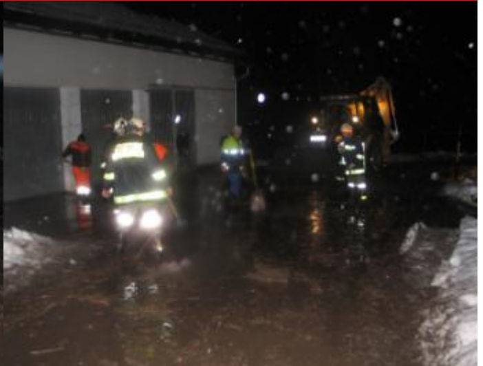
Überflutung am 13.01.2011