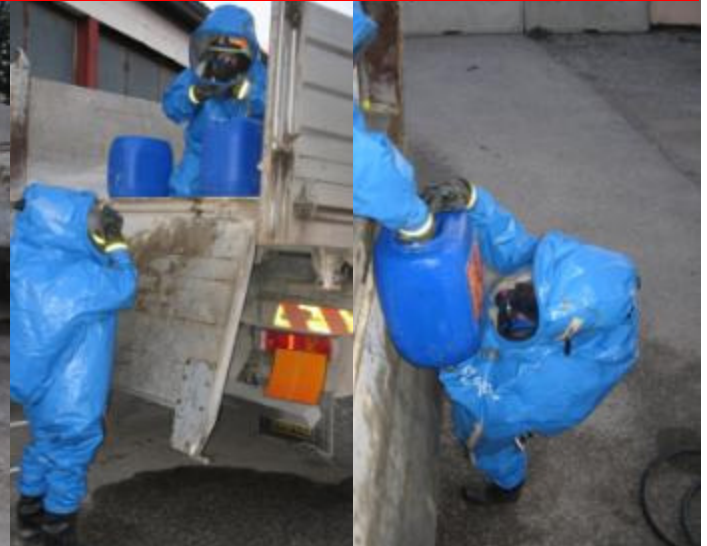
Übung 2. Zug Vollschutz