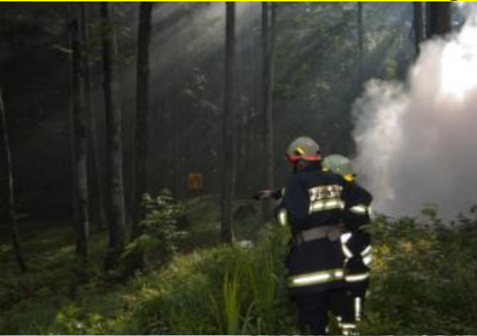
ALST III und FuB Übung – Parnstall am 04.06.2011