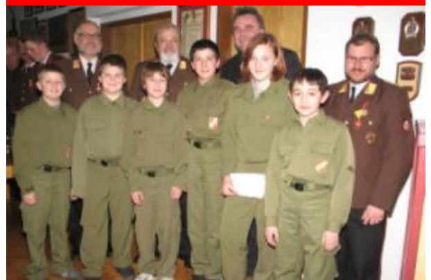
Angelobung der Jugend