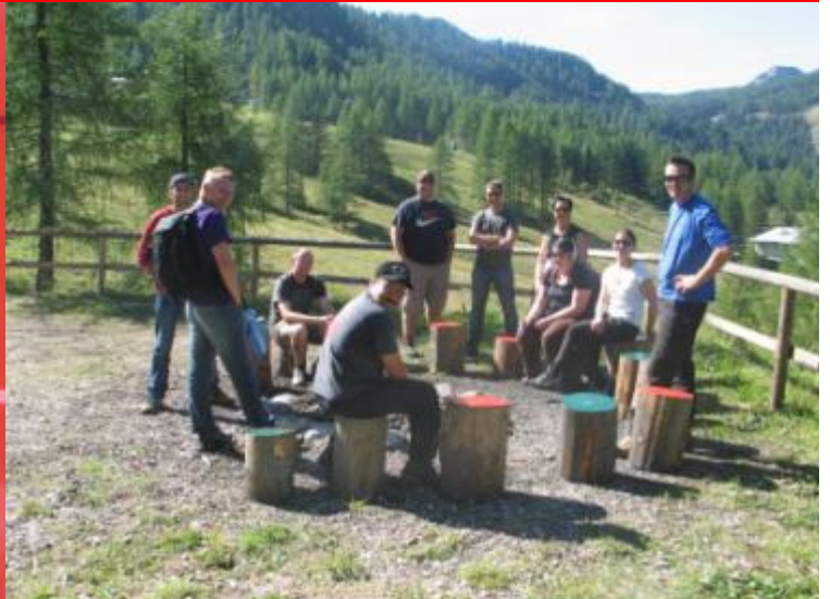
Im Gegensatz zu den Erwachsenen – MACH mal PAUSE