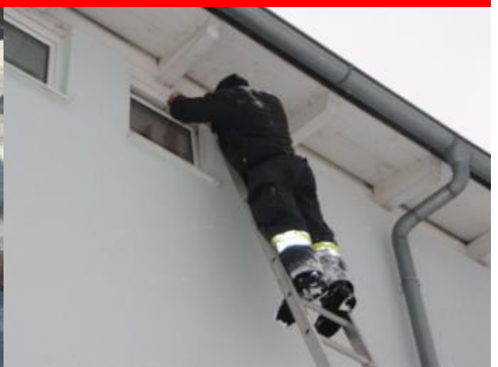
Türöffnung am 24.01.2011