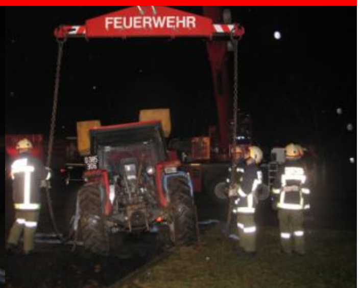
techn. Übung am 18.02.2011