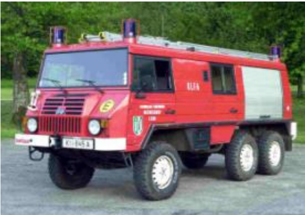
Pumpe 1: Steyr Daimler Puch Pinzgauer, Bj 1990, Turbodiesel, 77 KW, GG: 3,5 to. TS Fox mit KLF Ausrüstung, alternativ mobiler Lastenlift, Baumkletterausrüstung.