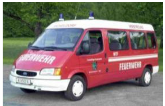
MTF 1: Ford Transit, Bj 1999, Turbodiesel, 73 KW Mannschaftstransportfahrzeug, Feuerlöscher, Erste Hilfeeinrichtung, Anhängervorrichtung