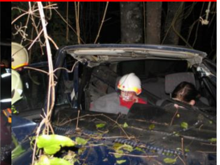
Übung technischer Zug 11.11.2011