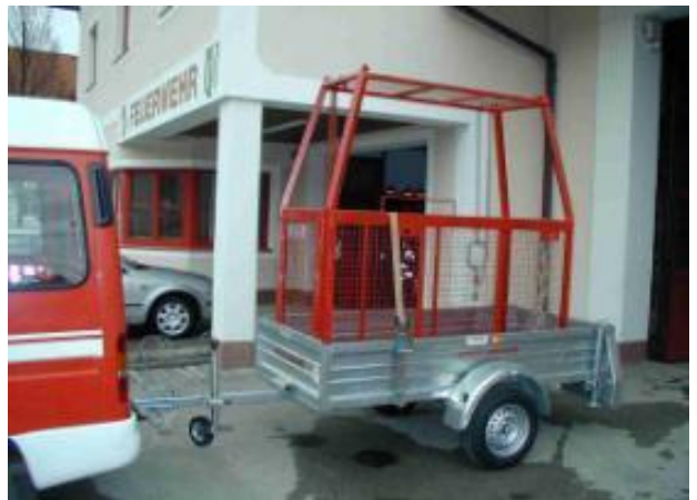
Anhänger für Rettungskorb, Fa. Stetzl, 2,3 m x 1,1 m, BJ 2002, ungebremst Nicht abgebildet: