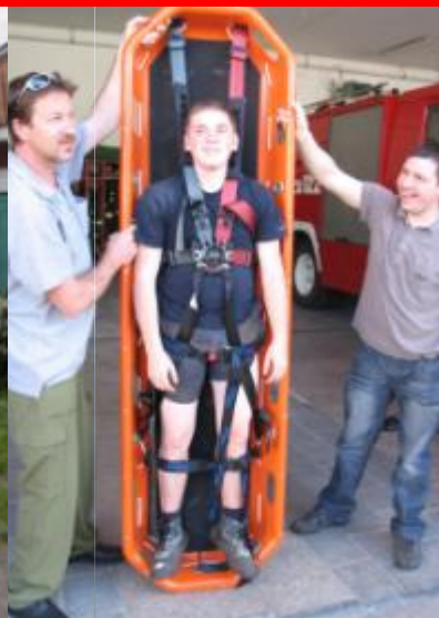
Die Haltegurte sitzen perfekt!