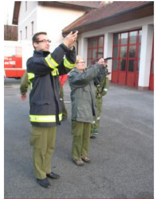
Funklehrgang – November 2011