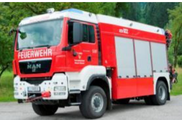
SRF: MAN 18.360 TGS 4x4, Bj 2009, 265KW Euro 4, GG: 18to, Stützpunktfahrzeug Generator 40 kVA, Lichtmast Flexilight, Seilwinde Rotzler 8to Zug, 80m Seil, Ladekran Hiab 166E-5, Umfangreiche