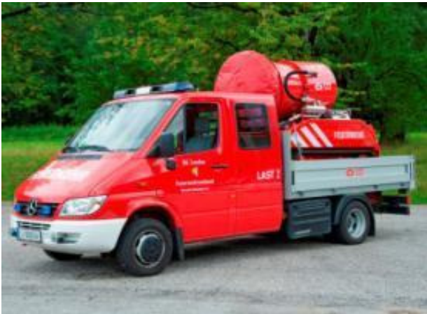
Last 2: Mercedes Benz Sprinter 416 CDI , Bj 2004, Turbodiesel, 115 KW, GG: 4,6 to. Trägerfahrzeug für Luf 60

LUF 60: Deutz Turbodiesel 78 KW, GG: 2,0 to, Wasserverbrauch 400l/min Lüfterleistung: 70.000m 3 /h. Fahrgeschwindigkeit max 6km/h, Steigfähigkeit 30%, Hydraulischer Antrieb, Ferngesteuert mit einer Reichweite von 300 m.