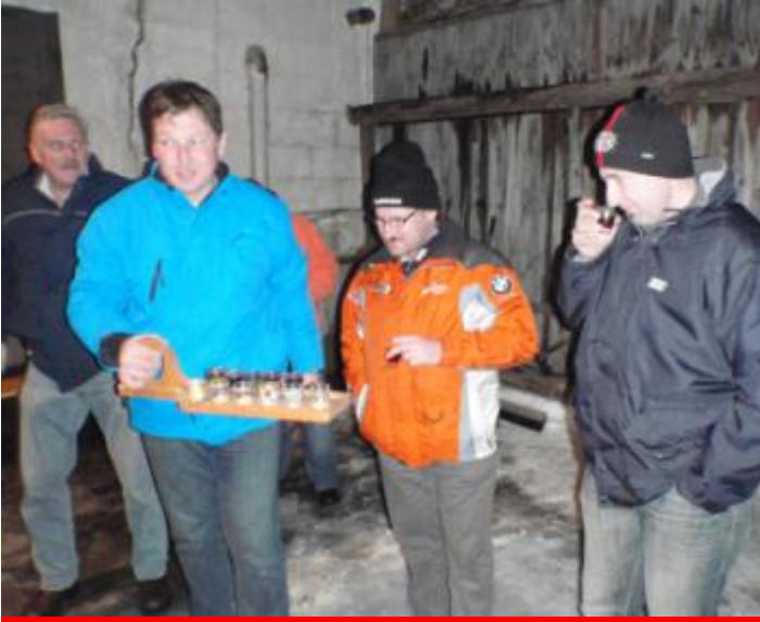
Flüssige Stärkung vor dem kräftezerrenden Turnier gegen die Kameraden der FF Altpernstein!