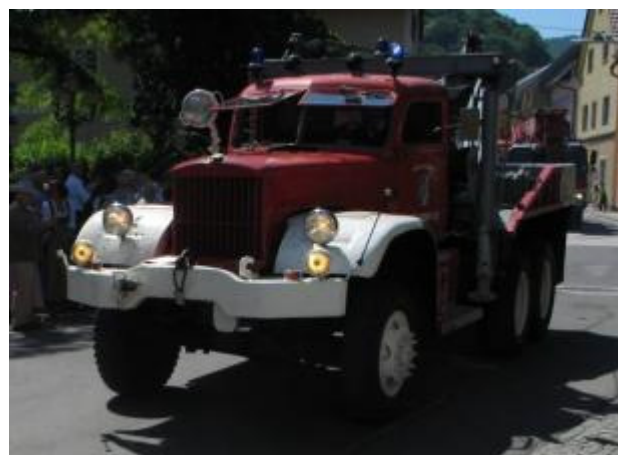
Kranfahrzeug: Dodge, Hubleistung: 5 to, Seilwinde Zugkraft 18 to, Im Einsatz: 1980 bis 1987 gekauft von der FF Wels.