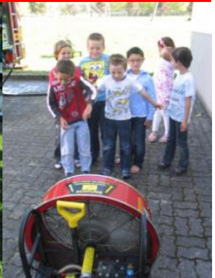
Übung Volksschule 03.10.2011