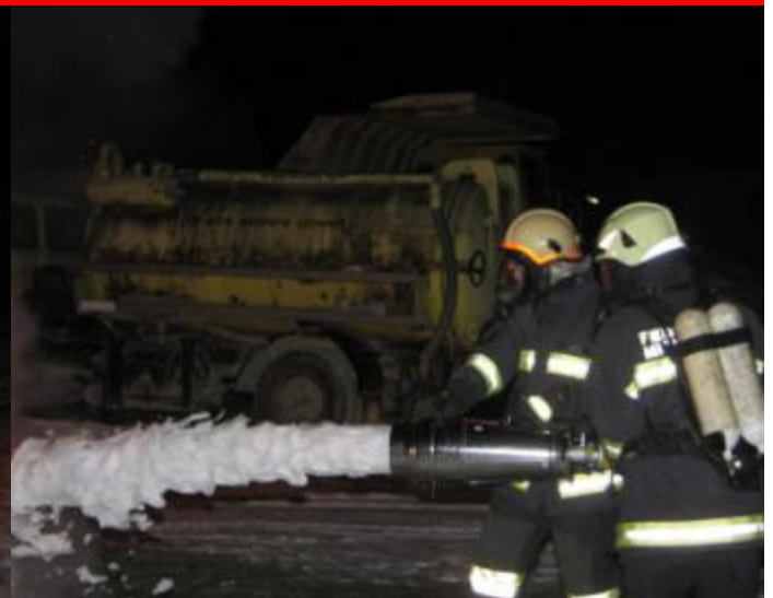
Übung KFZ-Brand 07.01.2011