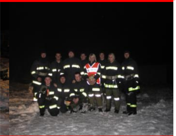
Übung KFZ-Brand 07.01.2011