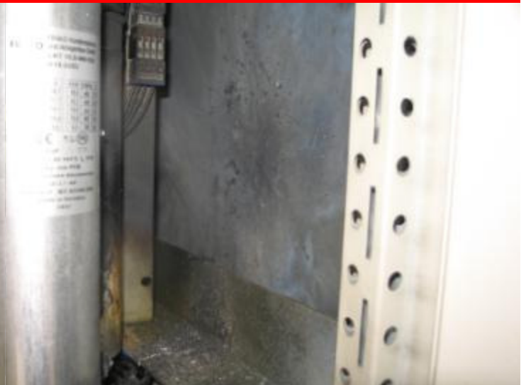
Brand A9 Betriebsgebäude - Elektrik