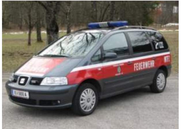
MTF 2: Seat Alhambra, Bj 2007, Turbodiesel, 103 KW, 7 Sitze Mannschaftstransportfahrzeug, Lotsenausüstung, Anhängervorrichtung

LUF 60: Deutz Turbodiesel 78 KW, GG: 2,0 to, Wasserverbrauch 400l/min Lüfterleistung: 70.000m 3 /h. Fahrgeschwindigkeit max 6km/h, Steigfähigkeit 30%, Hydraulischer Antrieb, Ferngesteuert mit einer Reichweite von 300 m.