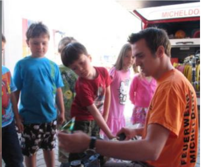
Der Kindergarten Micheldorf zu Besuch bei der Feuerwehr!