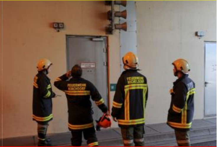
Brandmeldealarm A9 Grünbrücke Hinterburg am 16.08.2011