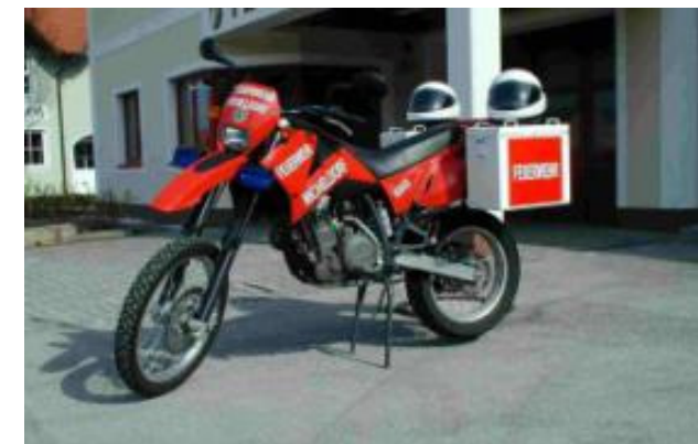
Krad: KTM LC4 640, Bj 1999 Lotsen, Suchdienst, unwegsames Gelände, Erkundungsfahrten