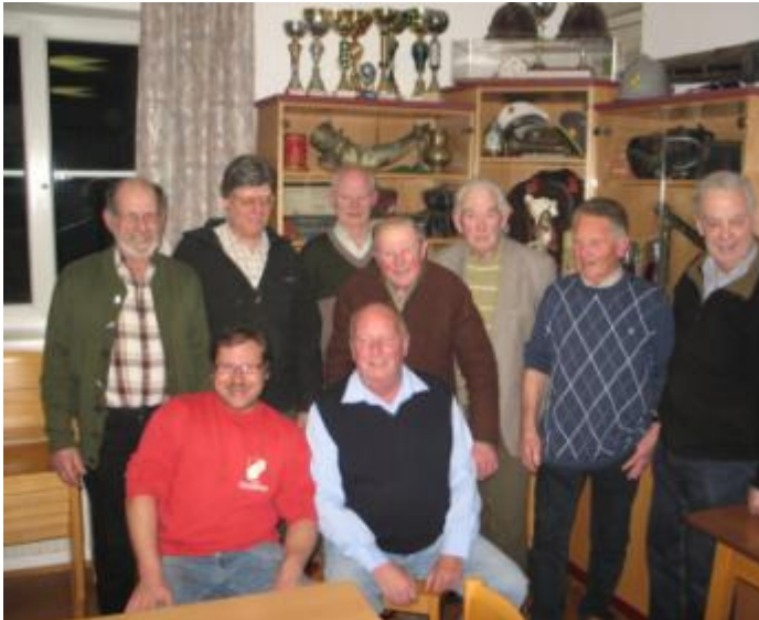
Unsere rüstigen Altgedienten. Die Jüngsten dürfen sitzen?