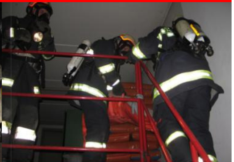
Gruppenübung Atemschutz am 16.03.2011