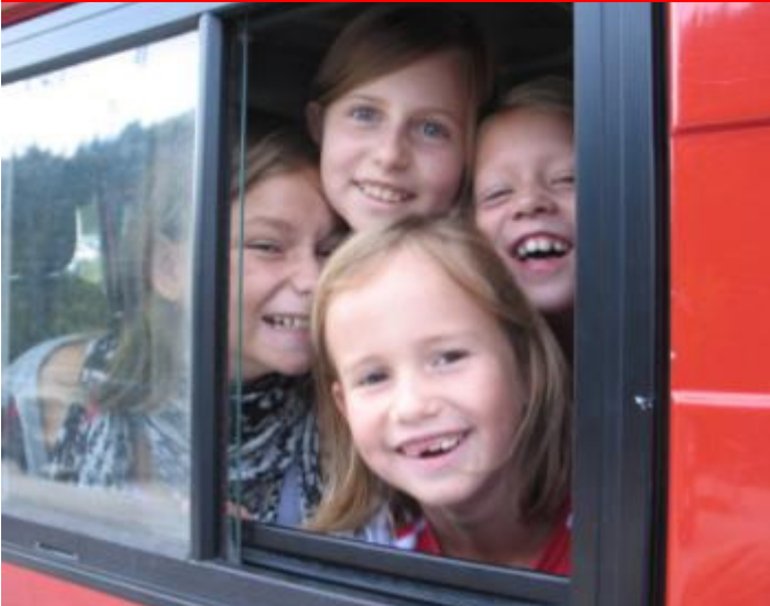
Wir brauchen nicht marschieren!