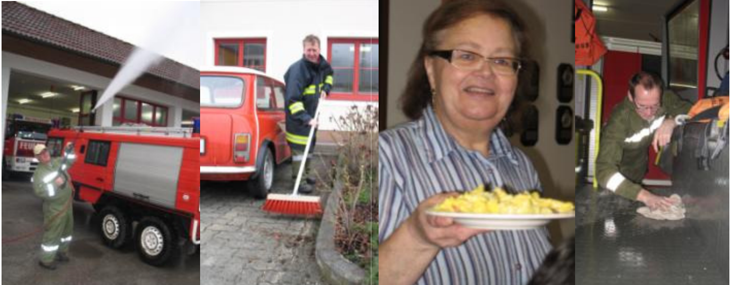
Frühjahrmusterung – voller Elan wurde einen halben Tag gewerkelt. Dann hieß es „OHNE MAMPF KEIN KAMPF“