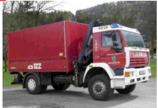
Last: Steyr 18S28, Bj 2000, 206KW, GG: 18to, Stützpunktfahrzeug Ladekran Hiab 102, Kranbegleitfahrzeug mit Anschlagmittel,....