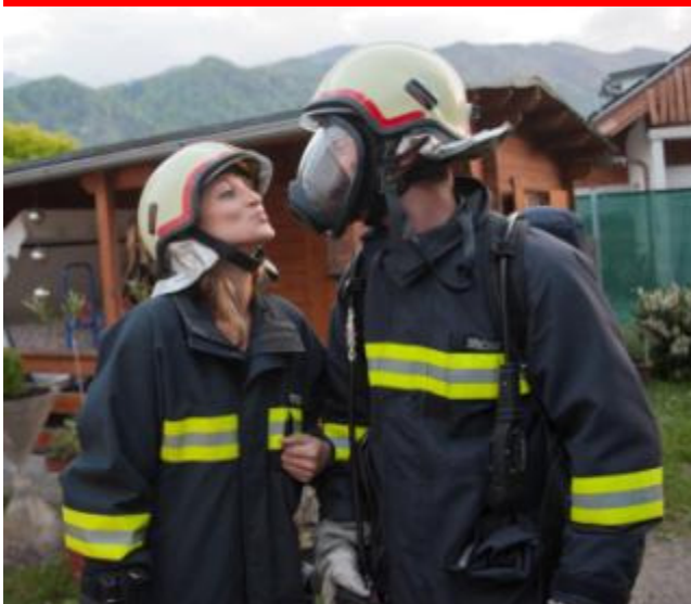
Ein Küßchen in Ehren, kann niemand verwehren!